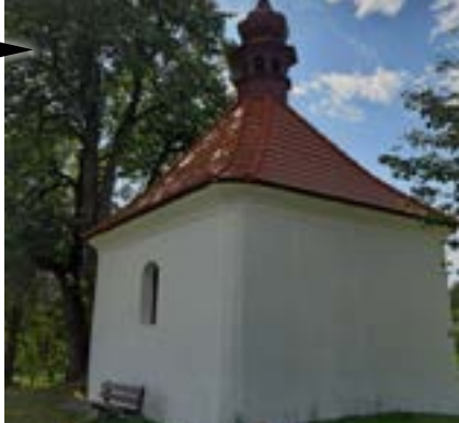
Mladá Vožice (Jihočeský kraj) Obnova Ústějovské kapličky