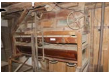
Mešno (Plzeňský kraj) Rekonstrukce mlýna (expozice historie mlynářství)