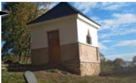
Žlutice (Karlovarský kraj) Oprava márnice