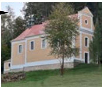
Luže-Doly (Pardubický kraj) Znovuzrození kostela – Cena souznění