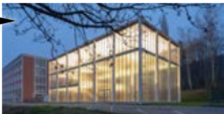
Zlín (Zlínský kraj) Obnova Památníku Tomáše Bati