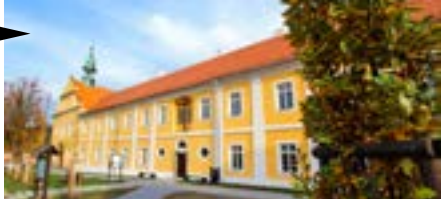
Votice (Středočeský kraj) Restaurování bývalého františkánského kláštera