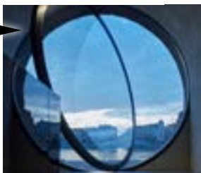
Praha 2 a Praha 5 (Hlavní město Praha) Revitalizace pražských náplavek – Cena za kreativitu