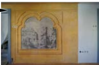
Prachatice (Jihočeský kraj) Nástěnné malby v měšťanském domě