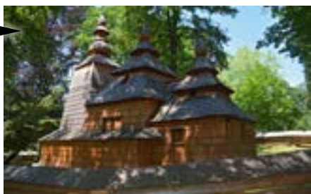
Hradec Králové (Královéhradecký kraj) Revitalizace roubeného kostela sv. Mikuláše