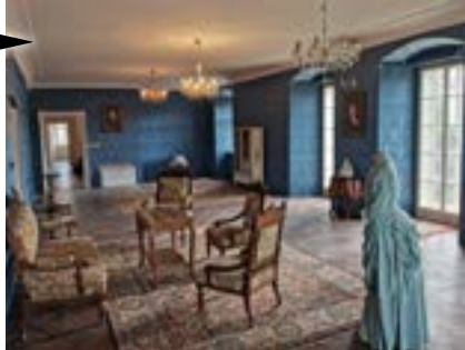
Bořanovice – Pakoměřice (Středočeský kraj) Obnova zámku – Cena souznění