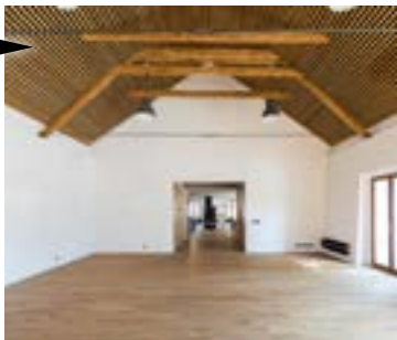
Máslovice (Středočeský kraj) Obnova Hospody – Cena souznění