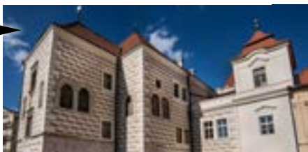
Želiv (Kraj Vysočina) Rehabilitace fasád premonstrátského kláštera