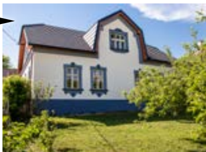
Kelč (Zlínský kraj) Rekonstrukce zemědělské usedlosti – Cena souznění