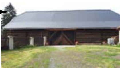
Mnichovo Hradiště (Středočeský kraj) Roubená farní stodola