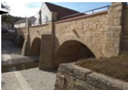
Sazená (Středočeský kraj) Obnova kamenného mostu