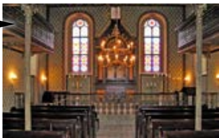
Heřmanův Městec (Pardubický kraj) Obnova synagogy